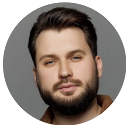
Врач стоматолог-хирург, ортопед, главный врач стоматологической клиники Estedental (Москва)

Временное протезирование является важнейшим этапом ортопедического лечения. В докладе обсуждаются клиническая ценность временных реставраций, особенности работы с временными конструкциями, выбор материалов и методов создания временных реставраций. Особое внимание будет уделено моделированию физиологичного контура мягких тканей с помощью временных коронок и мостовидных протезов, что способствует эффективной гигиене и достижению высокого эстетического результата протезирования.