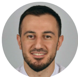
Врач-ортопед, терапевт (Нижневартовск)