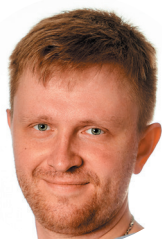
Врач стоматолог-хирург, к.м.н. (Москва)