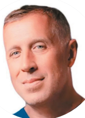
Главный врач, к.м.н., челюстно-лицевой хирург, анестезиолог- реаниматолог (Москва)

В докладе обсуждаются ключевые аспекты планирования и проведения разрезов при различных стоматологических хирургических вмешательствах (в пределах подвижной или кератинизированной слизистой оболочки полости рта, посередине альвеолярного гребня, со смещением вестибулярно или язычно), а также варианты мобилизации лоскута