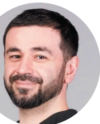
Врач стоматолог-хирург (Москва)

Практический разбор различных категорий тревожных пациентов: пациенты с дентофобией, дети, пациенты с негативным опытом лечения. Представлены клинические алгоритмы работы и организационные решения для стоматологических клиник Работа со страхом пациента — это отдельная компетенция врача